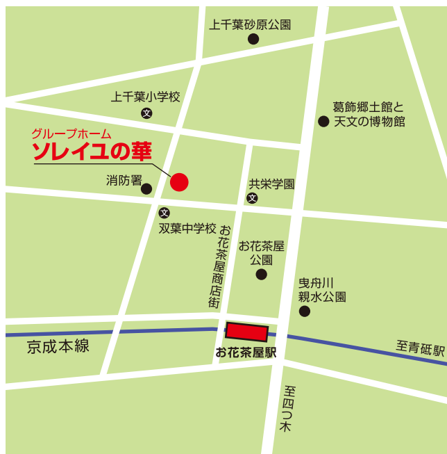
京成お花茶屋駅下車徒歩約7分

〒124-0003 東京都葛飾区お花茶屋 2-1-2 TEL.03-3601-2940 FAX.03-3601-2943 E-mail:soleiyunohana@city-wing.com