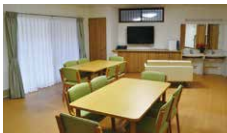
食事・談話コーナー

ソレイユの華は、認知症状のあるご高齢者が安心して暮らすことのできる生活の場所です。葛飾区内を走る京成お花茶屋駅から徒歩約7分の所にございます。近くには、曳舟親水公園や動物とふれあうことのできる上千葉砂原公園がありご入居者の憩いの場所となっております。ホームはちょっとした邸宅をイメージした和風の佇まいとなっており、ご入居される方に、ご家庭のような落ち着いた雰囲気を感じて頂けることと思います。お花茶屋は、下町に根付いた昔ながらの活気ある駅前商店街が有名です。端から端まで歩けば欲しい物がすべて揃ってしまうような商店街が毎日のお買い物コース。一軒一軒の店主さんとの会話を楽しむなど、生き生きとした楽しい毎日を過ごすことが出来ます。