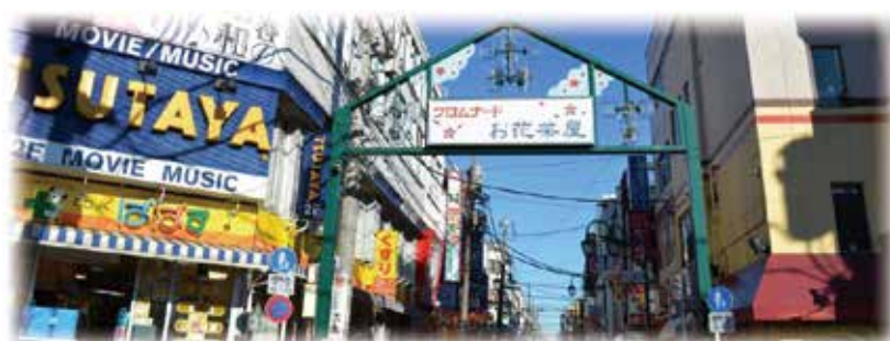
ホーム近くのお花茶屋商店街の風景