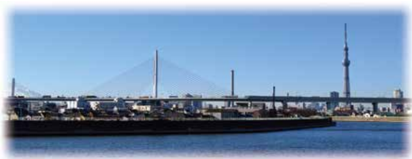
中川から望むかつしかハーブ橋と東京スカイツリー