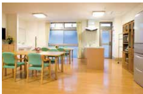
食事・談話コーナー

ソレイユの家は、認知症状のあるご高齢者が安心して暮らすことの出来る生活の場所です。葛飾区東立石を流れる中川沿いにございます。歩いて5分程の場所には、美しい緑と中川の水の潤いに満ちた広大な区民公園“東立石緑地公園”があり、公園から望むかつしかハーブ橋と東京スカイツリーのシルエットはとても綺麗です。また、公園の目の前にある本田中学校の生徒さんとは、開設以来の長いお付き合いで、毎年夏になると、ボランティアの生徒さんがホームを賑わせて下さいます。町会の老人会の皆さんや商店の方々からも温かいご支援を頂き、今ではすっかりソレイユの家の大応援団です。感謝の意味を込めた夏の大納涼祭は毎年たくさんの人で賑わう一大イベントとなっています。