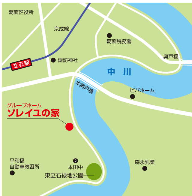
京成立石駅下車徒歩約7分

〒124-0013 東京都葛飾区東立石 4-20-1 TEL.03-5654-2940 FAX.03-5654-2948 E-mail:soleiyunoie@city-wing.com