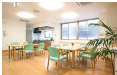
食事・談話コーナー

ご家族や地域の方々、ボランティアさんを招いて、季節感を楽しめる様々な行事やバスハイクを催すなど、誰もが気楽に足を運んで頂ける雰囲気を大切に、ご入居者と共に地域の皆さんに愛されるホームを目指しております。