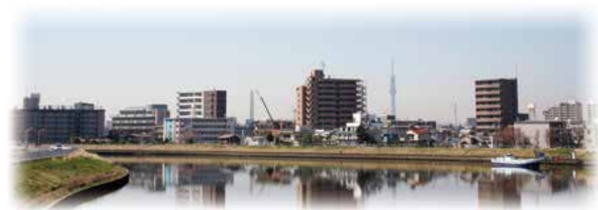
ホーム近く中川の風景